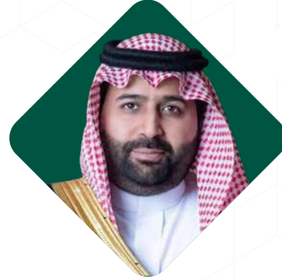
صاحب السمو الملكي

الأمير / محمد بن عبدالعزيز آل سعود أمير منطقة جازان